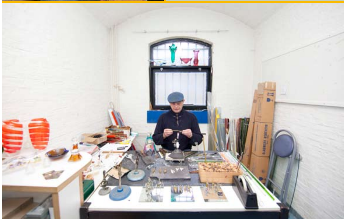
De oude nor is nu de werkruimte van allerlei creatieve personen.

De Blokhuispoort is open voor het publiek: bezoekers kunnen over de binnenplaatsen dwalen en de verschillende ateliers bezoeken aan het plein of in het cellenblok. Het is mogelijk om met een groep een rondleiding te krijgen door de gevangenis. Deze wordt gegeven door een oud-bewaker die daarbij uit eigen ervaring vertelt over het leven binnen de dikke muren. Regelmatig worden er evenementen gehouden in en rond het gebouw.