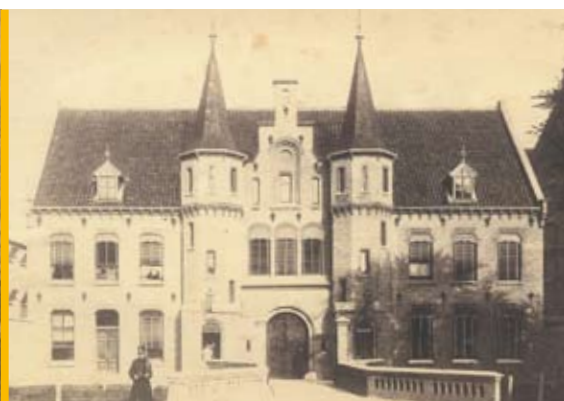
Op eeuwenoude tekeningen is de blokvorm nog goed te herkennen. Rechts: de Blokhuispoort rond 1905-1915.