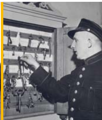
De voormalige vrouwenvleugel, uitzicht op de Blokhuispoort vanaf de Zuidergrachtswal (1905-1915) en een bewaker bij de sleutelkast, 1948.